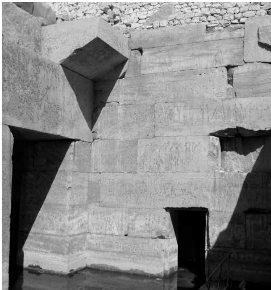
Auch die Südwand enthält eine Tür, die wohl in weitere Räumlichkeiten führt.