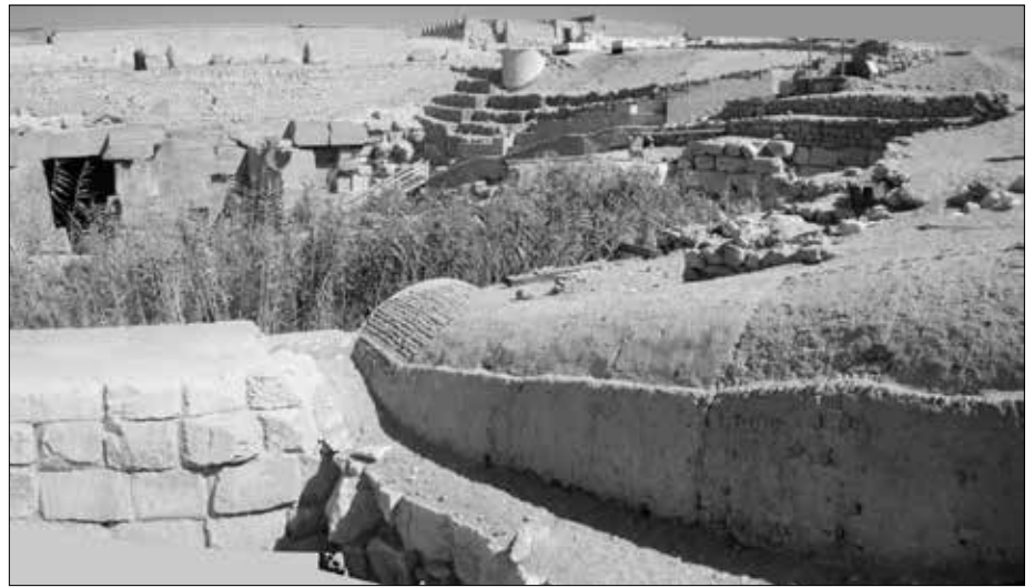
Rechts der mit Nilschlammziegeln überdachte abwärts führende Zugangs-Korridor, den man nicht betreten darf.

Von einem angeblichen „Tempelgraben“ konnte ich nichts erkennen. Von der ersten Halle, erbaut aus rosaroten Granitsteinblöcken, führte eine Pforte mit noch vorhandenem gewaltigen Türsturz in die Haupthalle mit zwei Reihen von jeweils fünf großen Pfeilern auf einer vom Wasser umgebenen „künstlichen Insel“, von der ich allerdings ebenfalls nichts entdecken konnte. Im Gegenteil ist der Boden der Halle völlig eben, was man auf alten Fotos erkennen kann, als er noch nicht überschwemmt war. Mit dieser Behauptung konnten die Ägyptologen jedoch dem Osireion die nach dem „Buch vom Tempel“ übliche Anordnung ägyptischer Tempelanlagen zuordnen, zu denen jeweils ein heiliger Hügel gehörte. Die Nord-, Süd- und Ostwand ist aufgrund von Erosion derart zerstört, dass keine Lesung der dortigen Hieroglyphen mehr möglich ist.