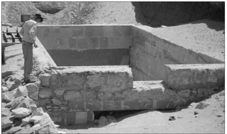
Eine der oben offenen Kammern im heutigen Zugang. Auch hier erkennt man eine ganz andere (primitivere) Bauweise als beim Osireion.