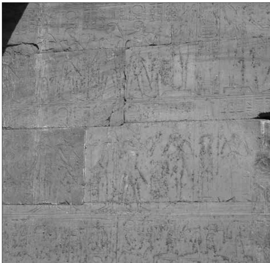
Die Südwand mit ihren kaum noch zu erkennenden Hieroglyphen und Figuren-Darstellungen.