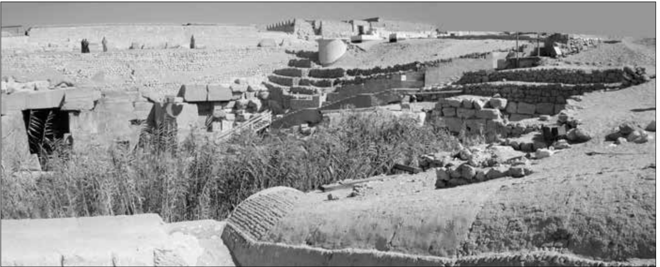
Das Osireion hinter dem Tempel des Sethos I. in Abydos, hier schlecht erkennbar hinter dem Schilfbewuchs. Unter dem Wulst, der sich unten nach rechts im Bild erstreckt, befindet sich der nicht betretbare Zugang.

Das Osireion (auch Osirion oder Osiron) im ägyptischen Abydos ist ein kleiner Tempelkomplex, der zu Ehren des altägyptischen Gottes Osiris errichtet wurde, erzählen uns die Ägyptologen. Die Anlage wird Pharaon Sethos I. zugeordnet, wohl, weil die Anlage südwestlich unmittelbar an den dortigen Sethos-Totentempel anschließt. Verschiedene Wände des Osireion sind zudem mit eingravierten Hieroglyphen versehen, die auf Sethos hinweisen.