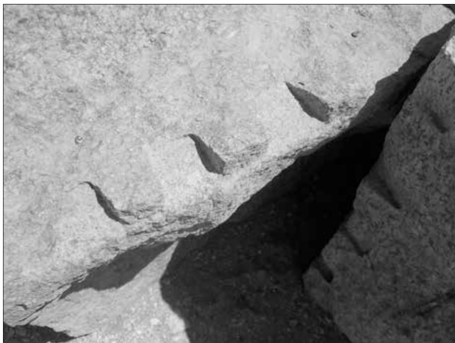
Mit roher Gewalt bekommt man alles kaputt, sogar Granitblöcke! Möglicherweise stammen diese aus der ehemaligen Dach-Abdeckung.