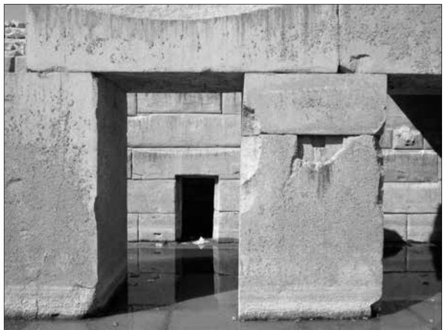
Durchblick auf die hintere Mauer mit einem der Türdurchgänge. Alles steht unter Wasser.

mehr oder weniger heißt, dass die Anlage vorher völlig schmucklos war. Der Name Sethos I. soll auf schwalben-