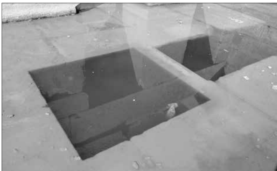
Zwei von mehreren Gruben oder Schächten. Man kann nicht viel erkennen, außer Reflexionen.