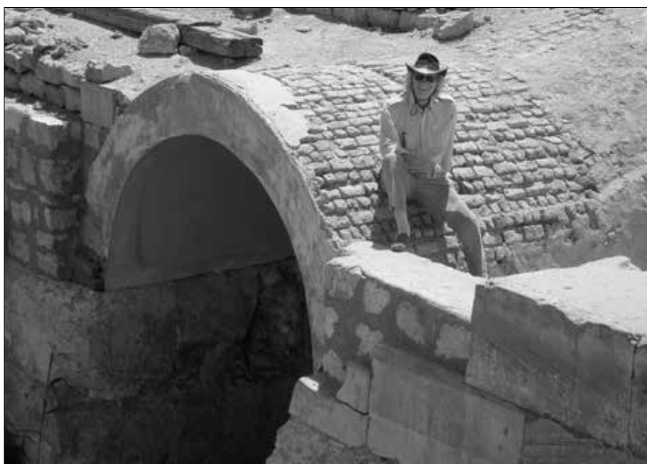
Der Zugang zum Osireion. Man erkennt auf den ersten Blick, dass hier eine ganz andere Bautechnik angewendet wurde – die Abdeckung mit Nilschlammziegeln! Die Bauherren des Osireion hätten diesen Zugang wohl mit Granitblöcken abgedeckt!