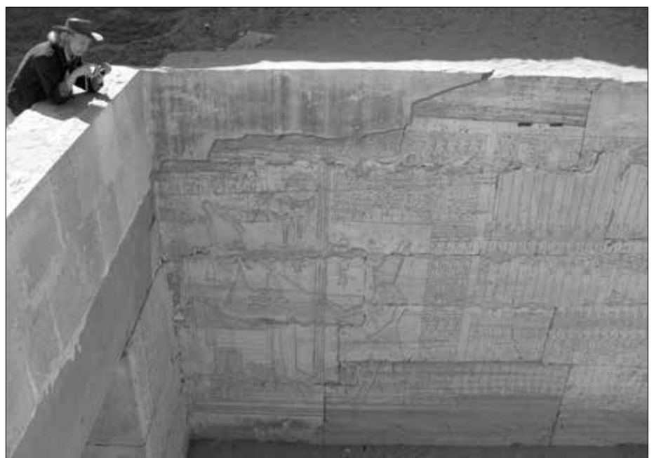
Blick in einen der oben offenen Kammern im heutigen Zugang. Die Wände sind mit Hieroglyphen und Figuren übersät.