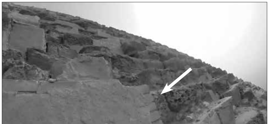
Mit Ziegelsteinen ausgebesserte Stelle (Pfeil) (YouTube-Einzelbild).