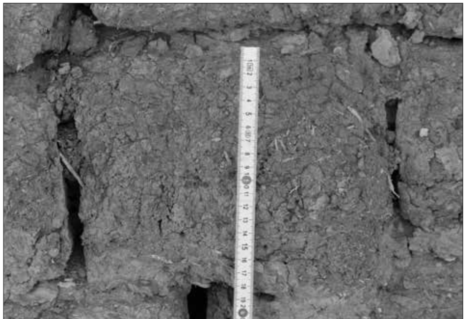
Nahaufnahme der in der Hawara-Pyramide verbauten Nilschlammziegel.