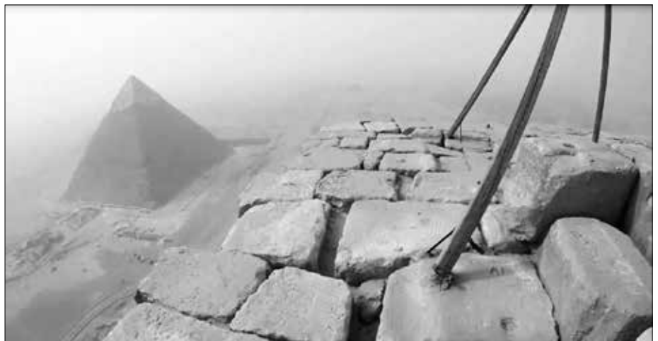
Auf der Spitze der Cheopspyramide: Auch hier kein Mörtel.