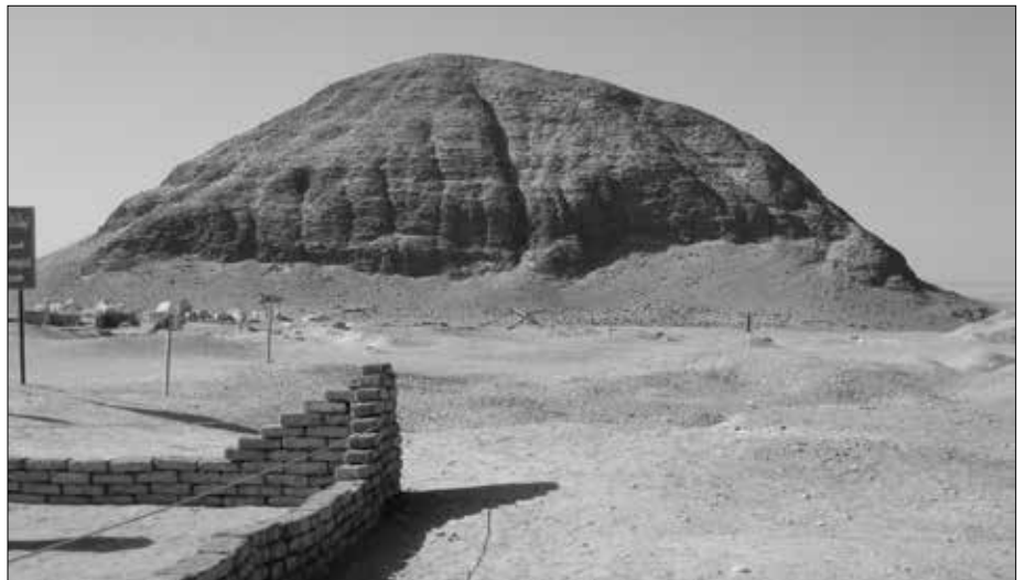
Die Hawara-Pyramide von Pharaon Amenemhet III. wurde ebenfalls aus luftgetrockneten Schlammziegeln errichtet. Man kann sich nur wundern, dass heute überhaupt noch etwas von ihr steht!