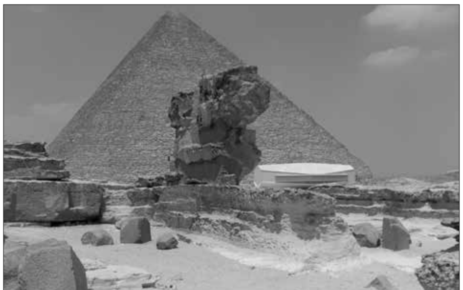
Detail des Chephren-Totentempels. Der Einfluss der gewaltigen Wasser-Zerstörungskraft ist nicht zu übersehen. Im Hintergrund die Cheopspyramide mit dem hässlichen Boots-Museum.