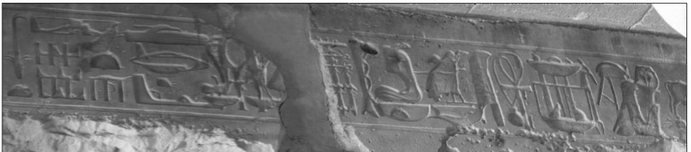
Der gesamte Fries, links der „Hubschrauber“.

tet wird. Er wird durch die Hieroglyphen Biene \text{𓆎} und Binse \text{𓆏} über dem Zeichen für „ein Teil der Erde“ \text{𓆑} dargestellt. Die weitere Symbolik des Herrinnennamens resultiert in dem Gedanken, dass die Herrinnen Ägyptens Elkâb (Nechbet, geiergestaltig = ) und