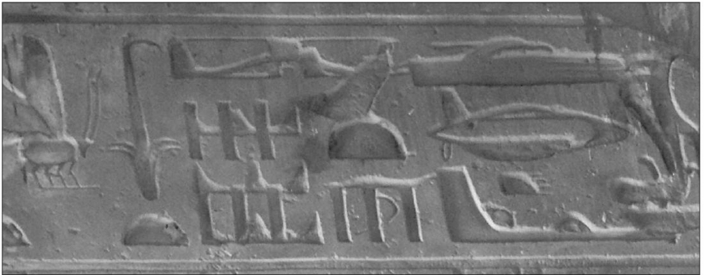
Man kann so viel hinein deuten: Hubschrauber, Panzer, U-Boot, Maschinenpistole ...

sucher besser kaschiert werden. Heute sind hingegen nur noch spärliche Farbreste vorhanden.