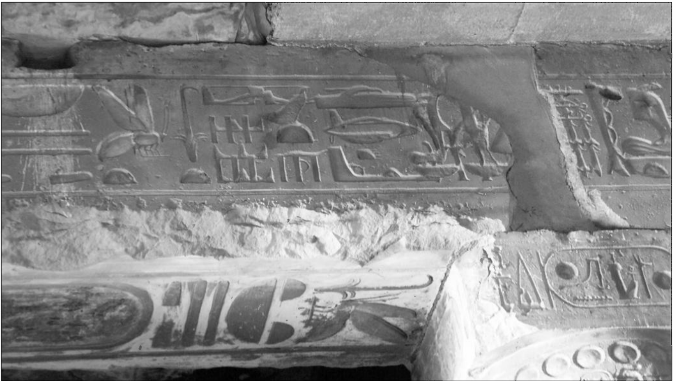
Der „Hubschrauber-Fries“ im Sethos I.-Tempel in Abydos.

Er ist nicht aus der Welt zu schaffen, der „Hubschrauber von Abydos“. Dabei handelt es sich um Hieroglyphen-Darstellungen auf einem Fries im Sethos I.-Tempel, deren eine gewisse Ähnlichkeit mit einem Hubschrauber aufweist. „Hubschrauber-Fries“ heißt dieser bei den einheimischen Führern inzwischen tatsächlich.