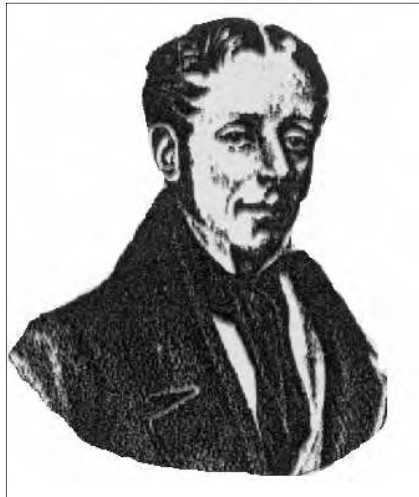
Richard Howard Vyse (1784-1853)

In einer der anderen Kammern fand man eine Kartusche mit dem