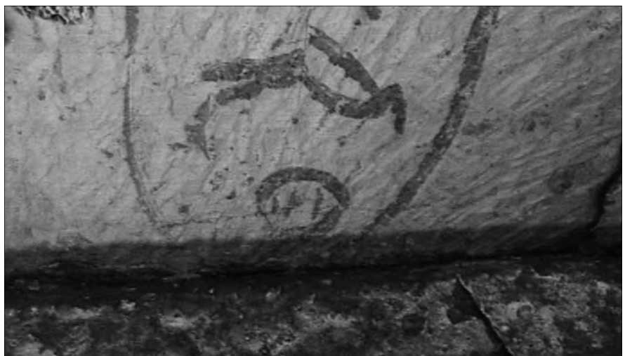
Eines der von Vyse aufgefundenen Zeichen in den „Entlastungskammern“. Die Kartusche reicht bis knapp an den Anschlussstein. Stadelmann bezeichnet sie immer noch (1991) als „Steinbruchinschrift mit dem Namen des Cheops ...“

Sollte Howard-Vyse sie gefälscht haben, dann eigentlich überaus dilettantisch, denn einige der Hieroglyphen, die er an die Wände der „Entlastungskammern“ malte, stehen auf dem Kopf, andere enthalten orthografische oder grammatikalische Fehler und wieder andere sind unidentifizierbar. Solche Fehler wären den alten Ägyptern kaum unterlaufen. Die als „Steinbruchzeichen“ hingestellten Inschriften lauten: