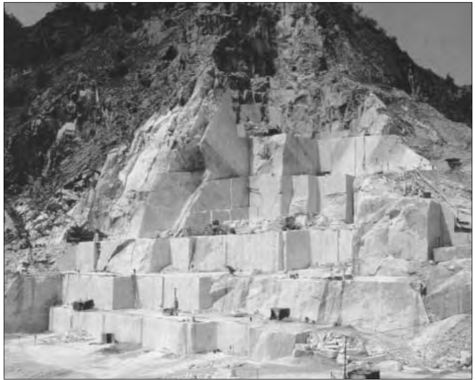
Marmorsteinbruch in Carrara (Italien).

Demgemäß gibt es inzwischen Stimmen, die behaupten, die Außenverkleidung der Pyramiden habe aus Rosenquarz bestanden (siehe die noch erhaltene Verkleidung an der Spitze der Chephren-Pyramide), was allein von