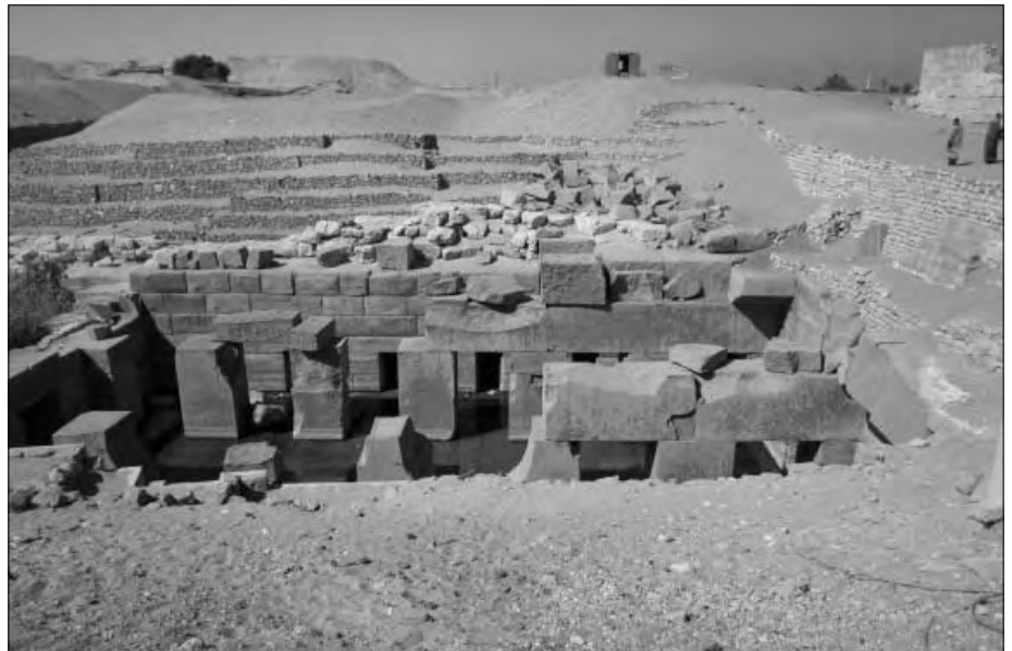
Blick auf die freigelegte Haupthalle des Osireions.

In diesem Beitrag möchte ich jedoch nicht über den Sethos-Tempel, sondern über das Osireion (auch Osirion, Osiron) schreiben, das sich von den Touristen unbeachtet hinter dem Tempel befindet (siehe das Google-Earth-Foto). Der Name „Osireion“ stammt von Flinders Petrie , der den Tempel zusammen mit Margaret Murray 1902 entdeckte. Dorthin verirren kann sich niemand, denn es gibt keine Möglichkeit, seitlich am Sethos-Tempel vorbei in den hinteren Bereich zu gelangen. Man muss also durch den Sethos-Tempel mit seinem Irrgarten an Gängen und Kammern hindurchgehen. Im hinteren Bereich be-