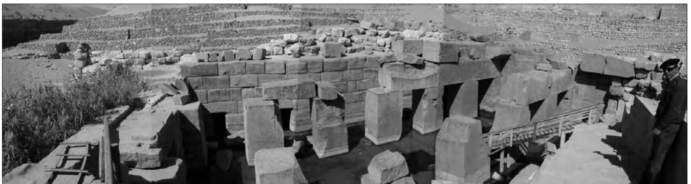
Panorama-Überblick über die Anlage.

Sicherheitsprobleme konnte ich keine feststellen. Die Ägypter sind nach wie vor freundlich und hilfsbereit, auch wenn erwartet wird, dass man ein Bakschisch gibt.