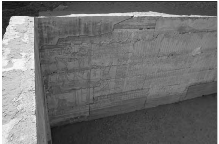
Die Wand ist mit Hieroglyphen und Bildern versehen.