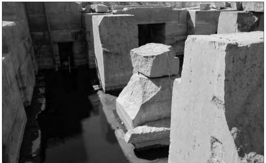
Ein weiterer Blick hinunter in die Haupthalle.