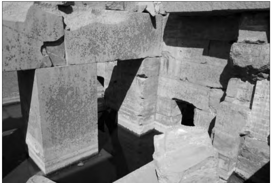
Man erkennt, welche gigantischen Steinblöcke hier verbaut wurden.

Sicher, die Ägyptologen beziehen sich auf die an verschiedenen Wänden angebrachten Hieroglyphen und Bild Darstellungen, um den Tempel datieren zu können. Das erscheint mir jedoch zu einfach zu sein, denn auch ich kann heute irgendwo Texte in ein altes Gemäuer ritzen. Das sagt dann allerdings