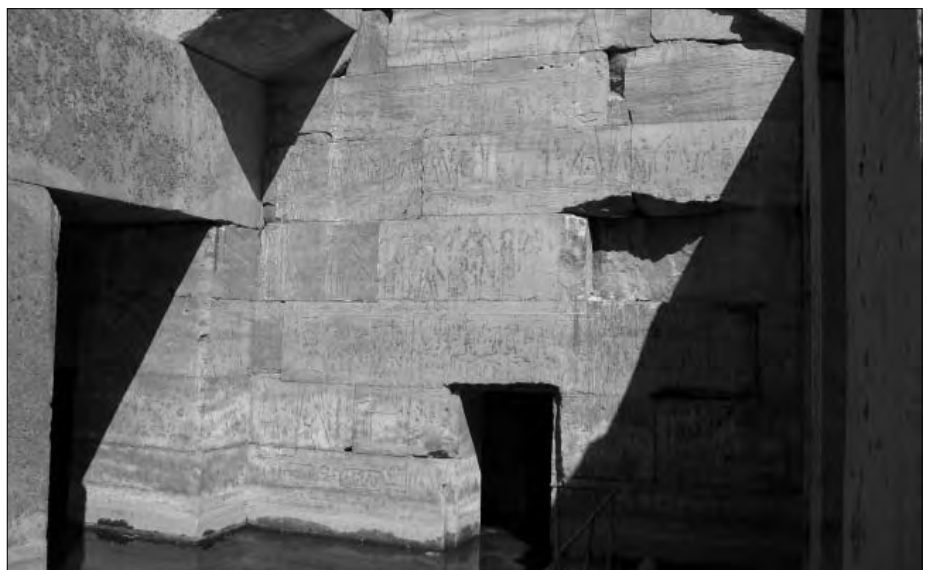
Die nordöstliche Wand der Haupthalle ist mit Hieroglyphen bedeckt. Ein Durchgang führt wohl in einen weiteren Raum.