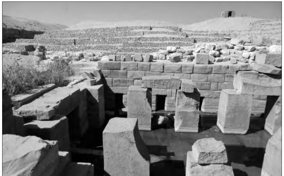
Die Haupthalle steht unter Wasser.