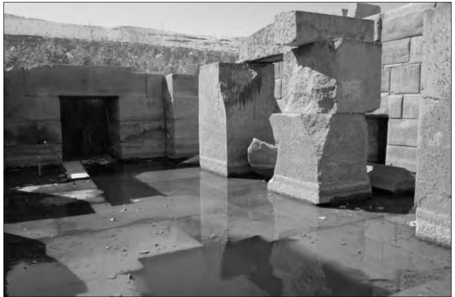
Der originale Zugang zur Haupthalle.

Der Zugang zu diesem Tempel befand (bzw. befindet sich immer noch, allerdings für Touristen gesperrt) sich im Südwesten der Anlage. Von dort führt ein Tunnelgang vielleicht dreißig Meter bis zu einem kleineren Raum. Hier hat man die Abdeckung entfernt, sodass