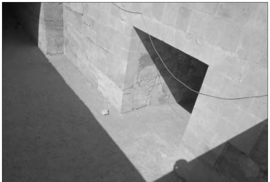
Der rechtwinklig abzweigende abwärts führende Gang zum Osireion.