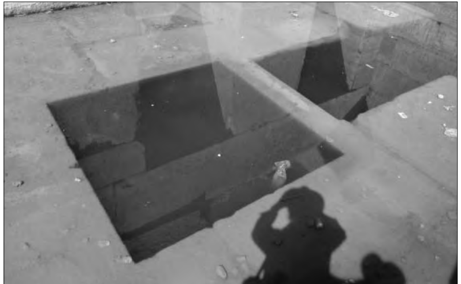
Quadratische bzw. rechteckige Schächte im Boden lassen vermuten, dass es noch weitere Räumlichkeiten unterhalb gibt, die ebenfalls geflutet sind.