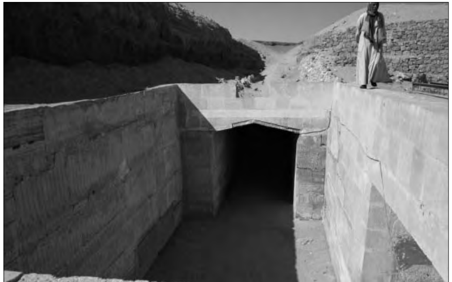
Der freigelegte Raum im Zugangsstollen. Hier biegt der Gang rechtwinklig ab.

Deshalb frage ich ketzerisch: Stellt das Osireion nicht vielmehr eine Hinterlassenschaft einer ehemaligen Vorkultur dar, die auf wesentlich höherem technischem Niveau stand als die späteren Pharaonenreiche? Im Urzustand dürfte diese Anlage aufgrund der verbauten gigantischen Granitblöcke sogar atombombensicher gewesen sein! Welchem Zweck dienten diese Räumlichkeiten also ursprünglich? Offiziell heißt es, es sei ein Tempel gewesen, in dem irgendwelche Riten stattgefunden hätten. Mag sein, dass das in späterer Zeit wirklich so war. Aber ursprünglich? Ob wir jemals den wahren Sinn und Zweck sowie die tatsächlichen Erbauer herausfinden können? ■