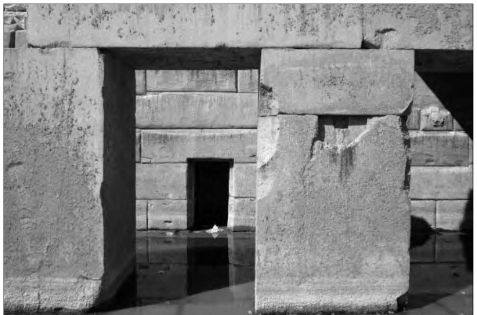
Durchgang zu einem weiteren Raum.