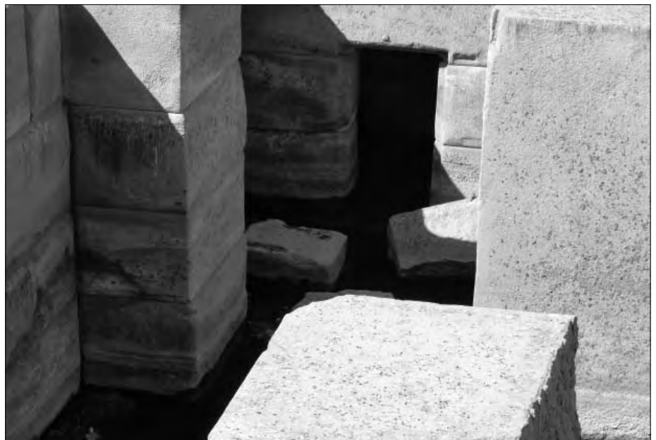
Man erkennt, welche gigantischen Steinblöcke hier verbaut wurden.