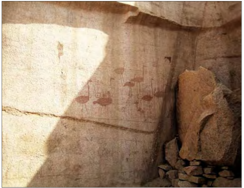
Die Vogel-Wandmalereien an der Bilderwand befinden sich rund zwei Meter über dem Bodenniveau.