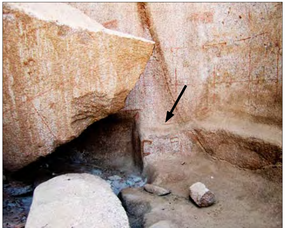
Die hintere Querwand. Hier sind Steinbrucharbeiter-Zeichen (?) aufgemalt (Pfeil). Man beachte auch die aufgemalten Linien. Der Felsblock links hat sich wohl nicht an die aufgemalten Vorgaben gehalten.

Die Wand wurde – wie auch die anschließende Querwand – wohl in pharaonischer Zeit mit senkrecht und waagrecht verlaufenden Linien versehen, die wohl als Anhaltspunkte für das Brechen der Steinblöcke dienen sollten, was jedoch nicht mehr ausgeführt wurde. Die Zeichnungen wie auch die Linien wurden mit einer Art Rötelpigment aufgebracht, augenscheinlich mit derselben Farbe. Die Wand geht mit einer sanft gerundeten Ecke in eine geschätzt etwa fünf Meter breite Querwand über. Davor liegen größere Gesteinsbrocken. Auch sie sind mit Bruchlinien versehen, haben sich beim Ausbrechen jedoch nicht an die vorgegebenen Linien ge-