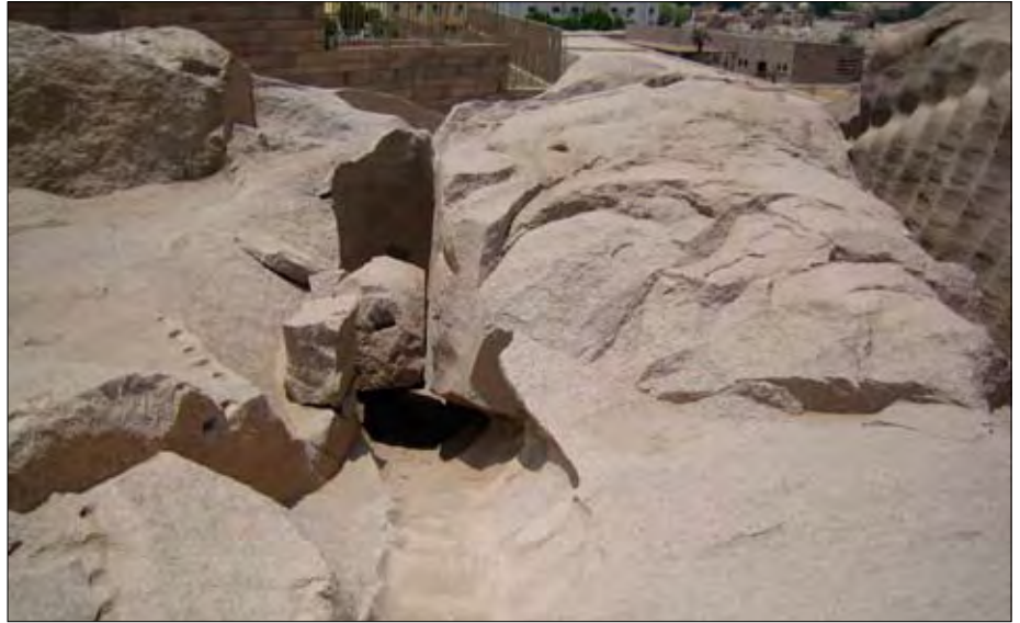
Gesperrter Bereich: Das sollte einmal ein Obelisk werden.

Hier kann man erstaunliche Dinge sehen: halb aus dem Granit gehauene Sarkophage sowie einen grob behauenen