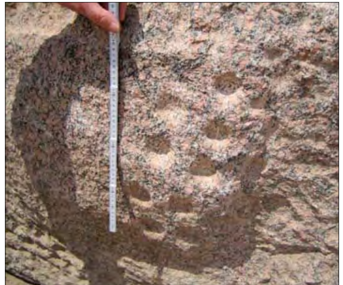
Gesperrter Bereich. Links: Bearbeiteter Felsen. Rechts: Detail.