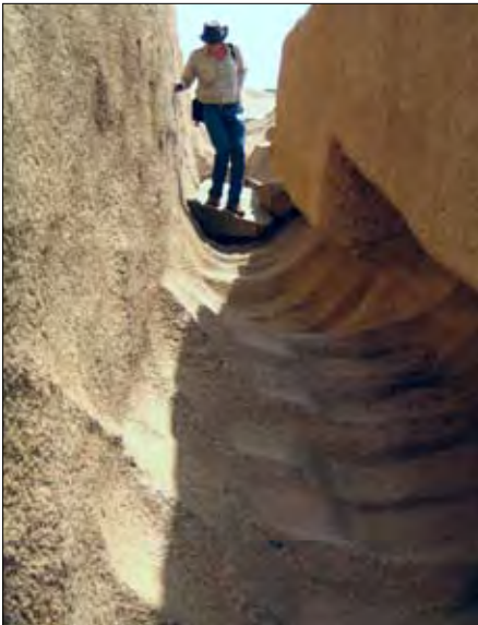
Der fast freigelegte Obelisk (siehe auch Fotos rechts).

Obelisk, der zwar nicht die Ausmaße des „unvollendeten“ hat, dafür jedoch auf der Unterseite bis auf einen rund dreißig Zentimeter breiten Steg bereits freigelegt ist. Diesen Obelisk hätte man möglicherweise relativ problemlos mittels einiger Holzstämmen loshebeln können. Die Fertigstellung (Nachbearbeitung, Politur usw.) wäre dann am Zielort erfolgt. Es stellt sich natürlich wieder die Frage, warum man ihn (sowie die angefangenen Stelen und Sarkophage) im Steinbruch einfach liegen ließ, denn die Herstellung bis zur derzeitigen Form (wenn es denn so stimmt: mittels Doleritkugeln) dürfte einen ziemlichen Zeit- und Arbeitsaufwand bedingt haben. Hatte etwa der Auftragsgeber vorzeitig das „Zeitliche gesegnet“? Warum hat