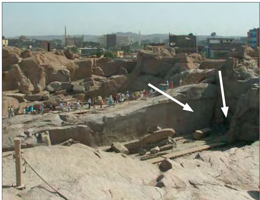
Die Bildwand im Steinbruch fand ich auf diesem Foto von einem früheren Besuch. Die Wandmalereien befinden sich im rechten Bereich der Wand (Pfeile).