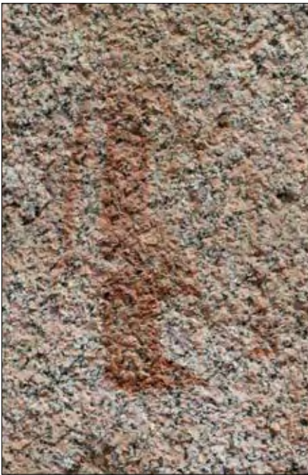
Eine stilisierte menschliche Figur.