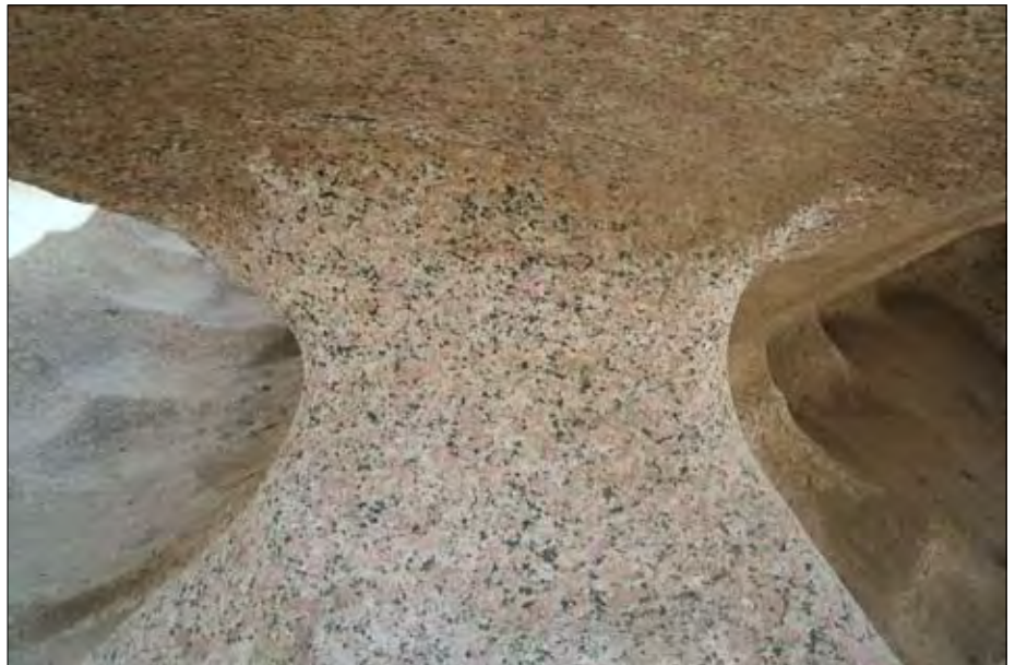
Der obige unfertige Obelisk ist auf der Unterseite bereits fast freigelegt.

Obelisk, der zwar nicht die Ausmaße des „unvollendeten“ hat, dafür jedoch auf der Unterseite bis auf einen rund dreißig Zentimeter breiten Steg bereits freigelegt ist. Diesen Obelisk hätte man möglicherweise relativ problemlos mittels einiger Holzstämmen loshebeln können. Die Fertigstellung (Nachbearbeitung, Politur usw.) wäre dann am Zielort erfolgt. Es stellt sich natürlich wieder die Frage, warum man ihn (sowie die angefangenen Stelen und Sarkophage) im Steinbruch einfach liegen ließ, denn die Herstellung bis zur derzeitigen Form (wenn es denn so stimmt: mittels Doleritkugeln) dürfte einen ziemlichen Zeit- und Arbeitsaufwand bedingt haben. Hatte etwa der Auftragsgeber vorzeitig das „Zeitliche gesegnet“? Warum hat