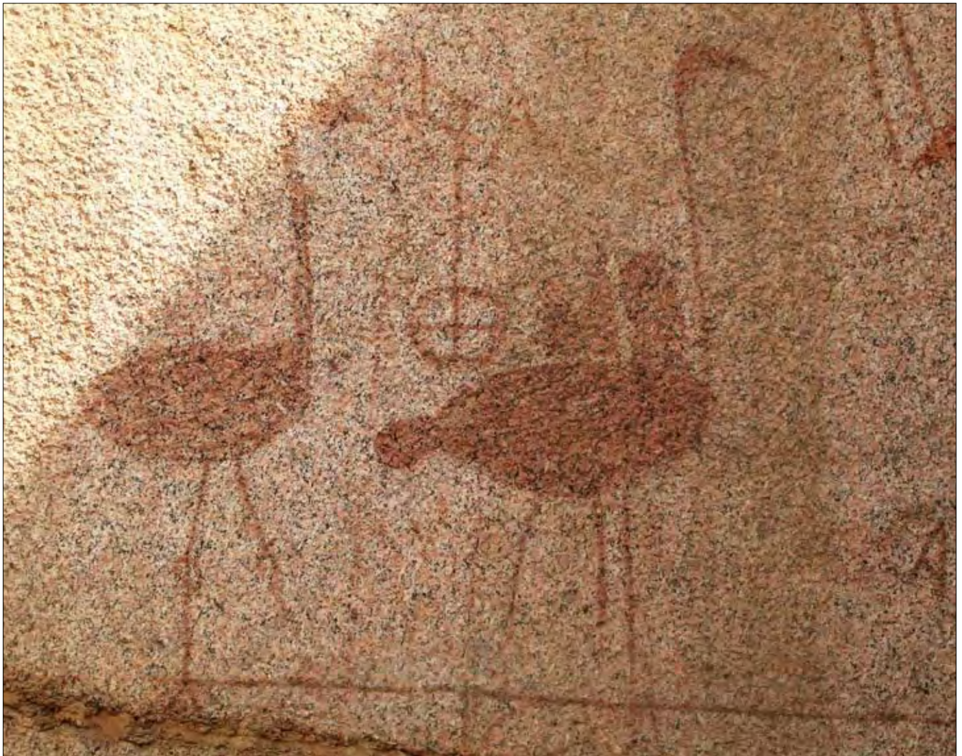
Zwei der Vögel. Der rechte besitzt eine Art Höcker wie ein Kamel. Zwischen den beiden Vögeln ein undefiniertes Zeichen. Die Linie unter den beiden Vögeln scheint eine Markierungslinie zum Herausbrechen der Steinblöcke zu sein.