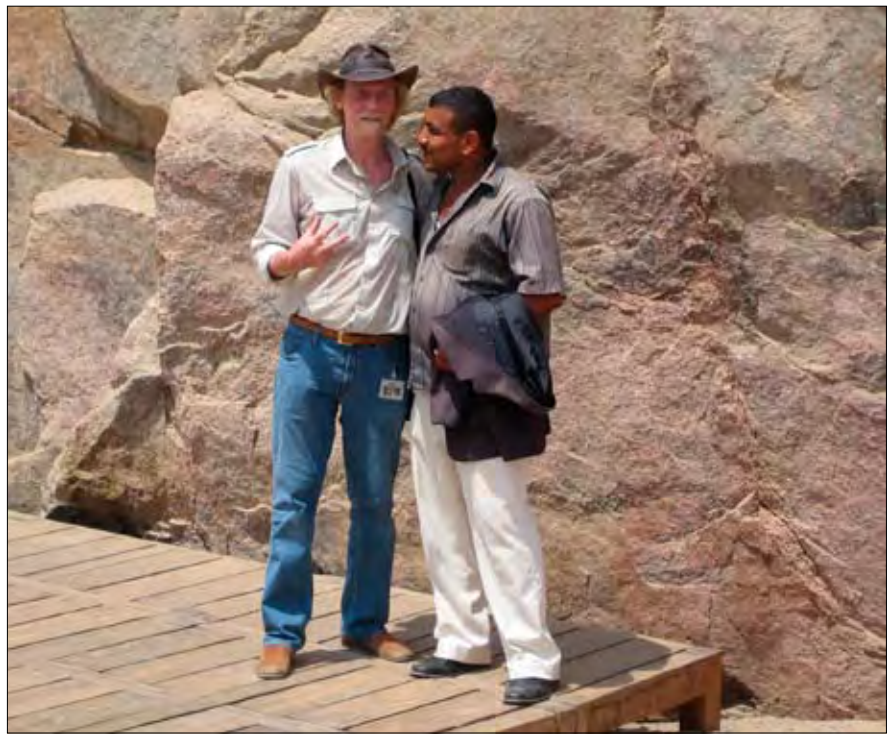
Der Autor im Zugangsbereich des Steinbruchs beim Verhandeln mit dem Sicherheitsposten.

Der Steinbruch hat jedoch noch weit mehr zu bieten, das den Touristen entgeht, weil sie meist schon mit einem Foto vor dem „unvollendeten“ Obelisk zufrieden sind. So gibt es dort etwa die prähistorischen (?) Wandmalereien, die bereits Axel Klitzke im SYNESIS-Magazin Nr. 1/2010 („Das Paradoxon im Granit-Steinbruch von Assuan“) beschrieben hat. Diese wollte ich natürlich mit eigenen Augen ansehen und fotografieren. Anhand meiner schon früher im Steinbruch gemachten Fotos konnte ich durch einen Vergleich bereits im Vorhinein die Wand lokalisieren, an der sich die Bilder befinden. Natürlich liegt sie außerhalb des offiziellen abgesperrten Touristenweges,