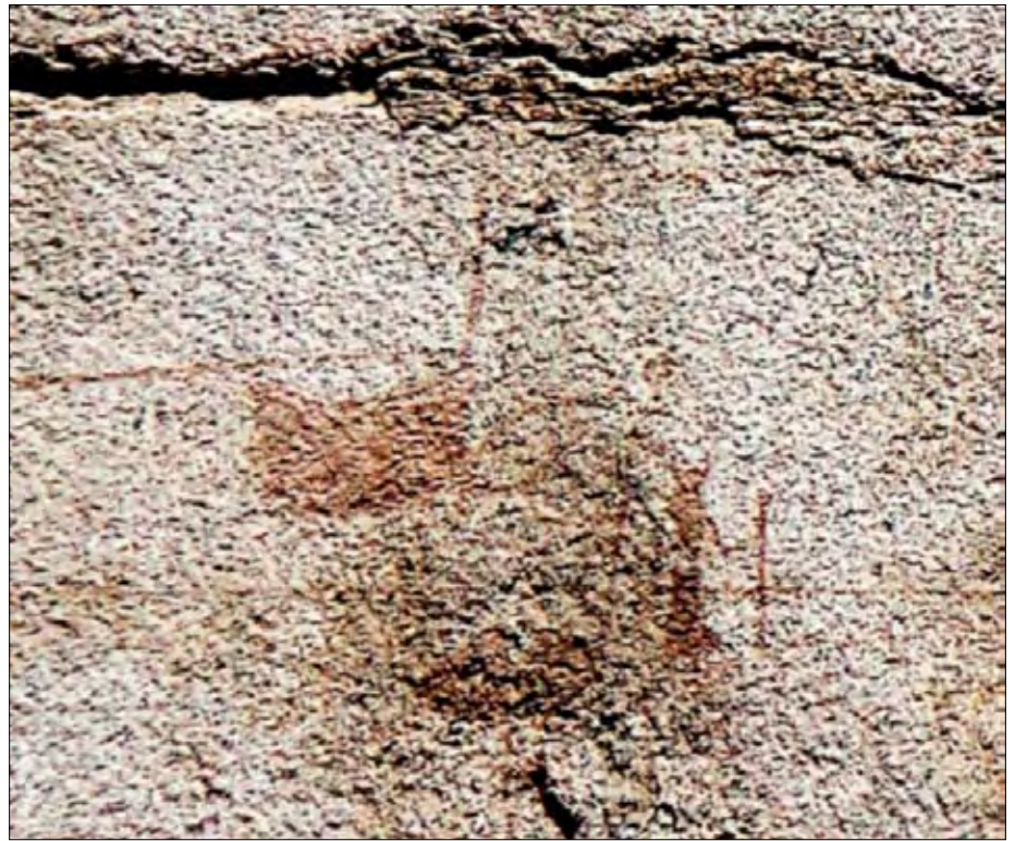
Zwei der Vögel mit einem stilisierten Jäger oder Hirten, der einen Hörnerhelm trägt.

den offiziellen Touristenweg zu verlassen, geradezu fürstlich in Euros honorieren.