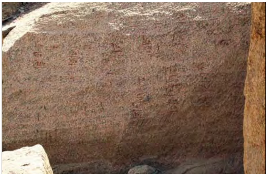
Gesperrter Bereich: Mit Schriftzeichen versehene geglättete Wand.