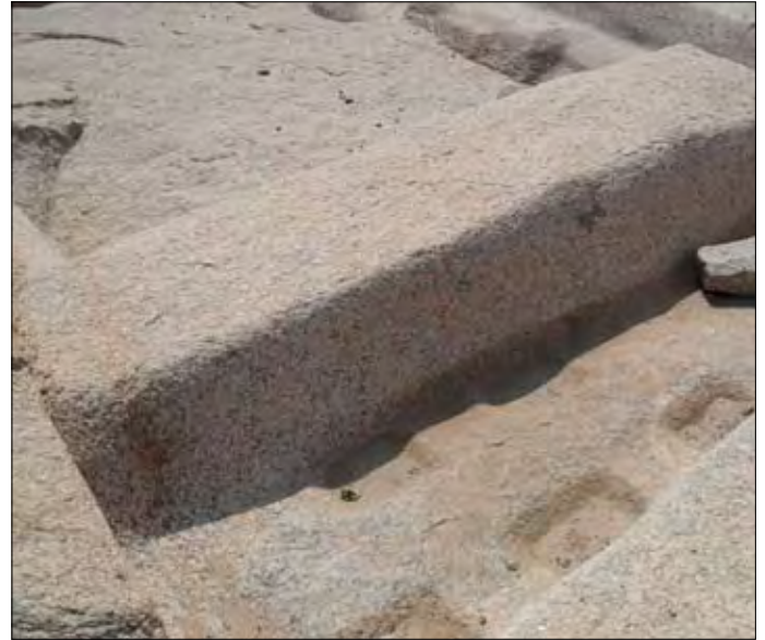
Gesperrter Bereich. Links: Bearbeiteter Granit-Felsen. Rechts: Noch mit dem Untergrund verbundener geplanter Sarkophag.