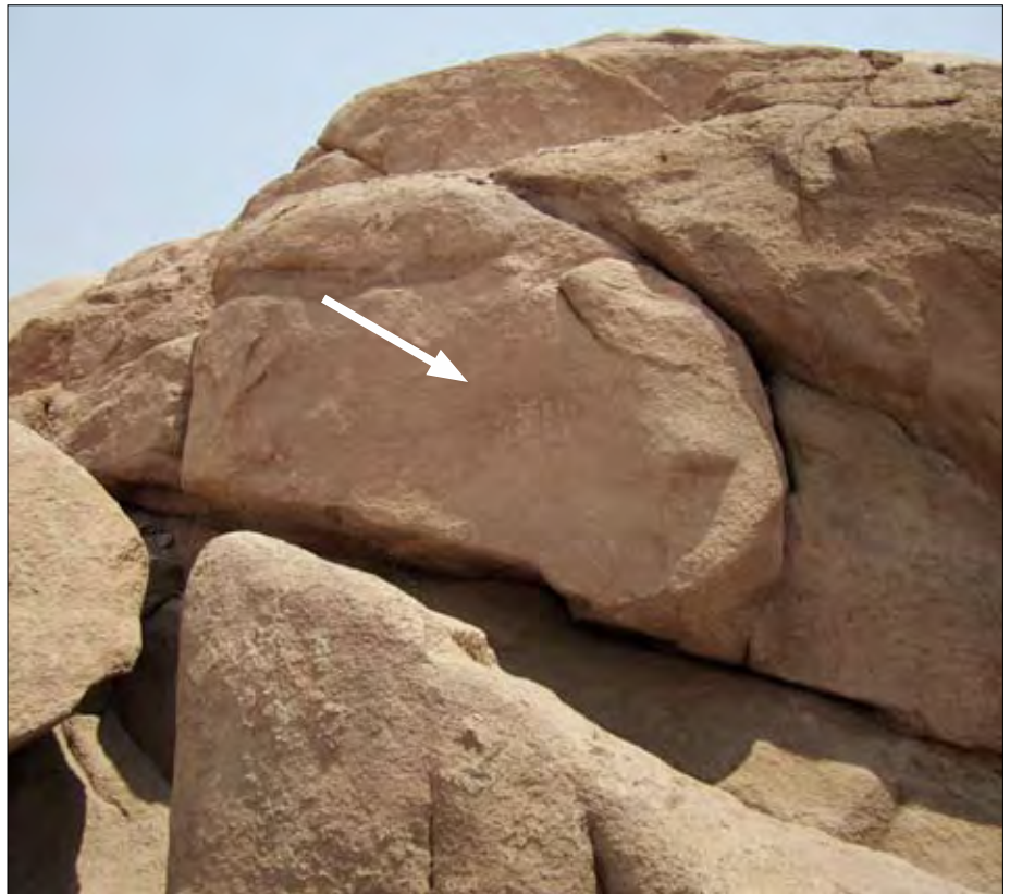
Abgesperrter Bereich. Oben: Schriftzeichen auf einer Felswand (Pfeil). Unten: Kontrastverstärkte Ausschnittsvergrößerung.

Ich bleibe bei meiner Feststellung, zu der ich schon früher kam: In diesem Steinbruch wurden die unterschiedlichsten Steinbearbeitungsmethoden eingesetzt, von Bearbeitungen durch (von mir aus) Doleritkugeln über Hammer-und-Meißel-Bearbeitung bis zur sogenannten Stockhammer-Bearbeitung, aber bitte nicht mittels Kupfergeräten, denn Kupfer ist viel zu weich, um damit auch nur einen Kratzer in Granit erzeugen zu können. Die Werkzeuge müssen zwangsläufig aus Stahl gewesen sein. Mit den Doleritkugeln lässt sich zwar trefflich auf Granit herum hämmern, jedoch keine der vorhandenen rechtwinkligen Bearbeitungen ausführen.